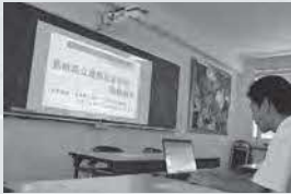
金・銀・銅サミット