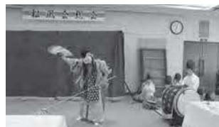
石見神楽部による「恵比須」