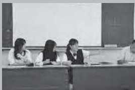
実行委員会の司会をする 来間社長