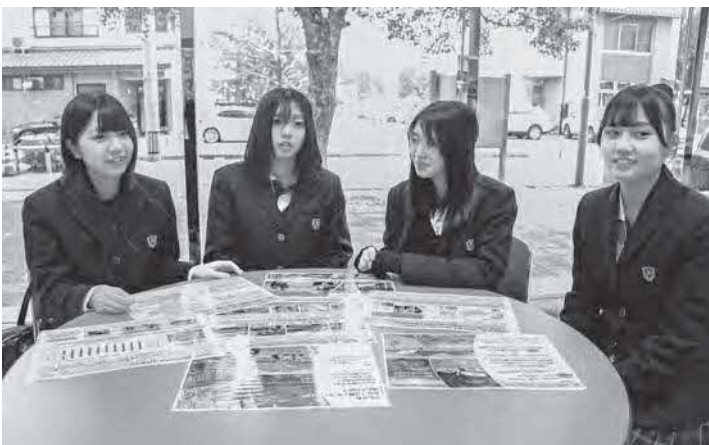
観光甲子園の決勝の前に打ち合わせする生徒たち