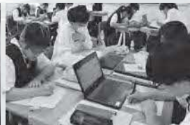
1年生「産業社会と人間」