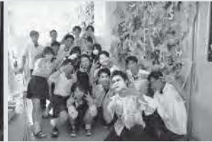
2年生企画「お化け屋敷」