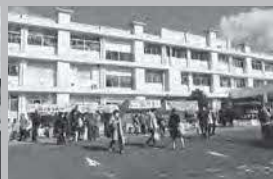
模擬店はキッチンカーを手配