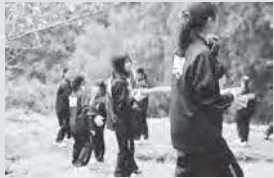
石見銀山保全活動