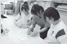
オープンスクール