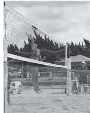
五色姫海浜公園ビーチバレーコートにて