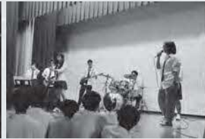
有志によるバンド演奏