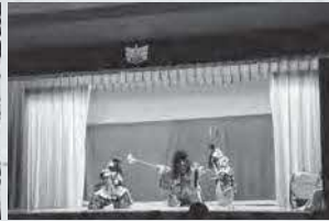
石見神楽部の演舞