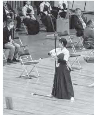
静岡県武道館にて