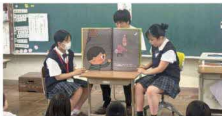
「もったいないばあさん」

6月と7月に「食と子ども系列・保育モデル」3年生が、仁摩小学校1年生への絵本の読み聞かせボランティアに出かけました。高校生は子どもたちが絵を見やすいようにと、仁摩図書館で大きな絵本を借りて行きました。小学生の子どもたちは高校生が読むお話を真剣に聞いてくれて、高校生も嬉しい気持ちになりました。これからも子どもたちに喜んでもらえるように、読み聞かせの技術を磨いていきたいと思えます。そして、10月からは2年生が行きますので、仁摩小学校のみなさん、楽しみに待っててください!